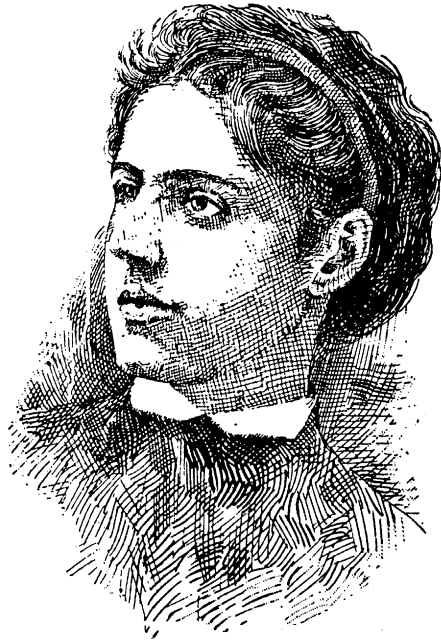
עמא לאזארוס (1889—1849)